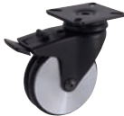
Beispiel Nr. 556.31.15